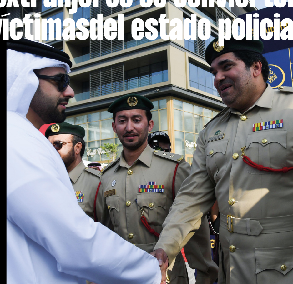
(Arriba a la derecha) Tayseer Al Najjar. (Centro a la derecha) Preso esposado. (Abajo a la derecha) Personal del ejército, la policía y los servicios de seguridad con un miembro de la familia gobernante de Dubái, 2018. (Arriba a la izquierda) Loujain al-Hathloul. (Abajo a la izquierda) Oficial de la policía de Abu Dabi en Hamdan Street, Abu Dabi.